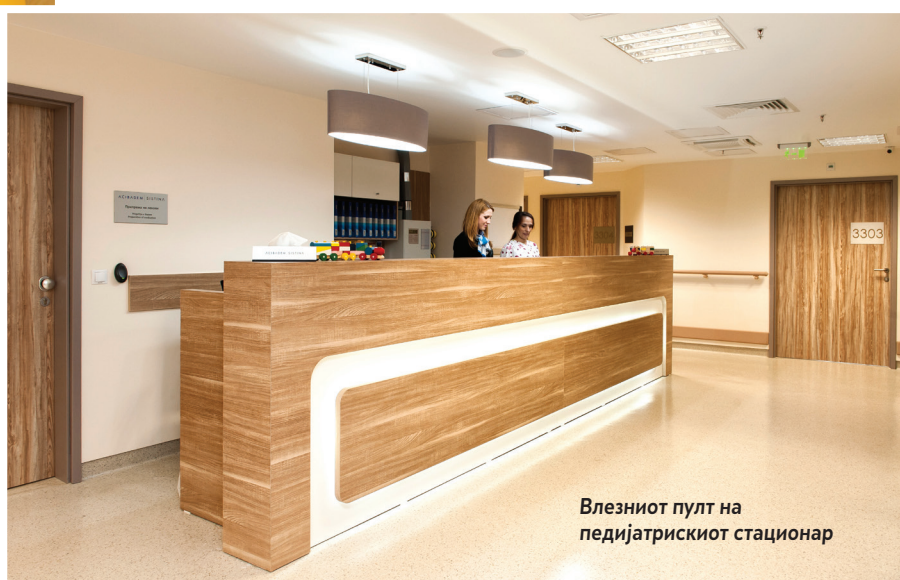
Влезниот пулт на педијатрскиот стационар