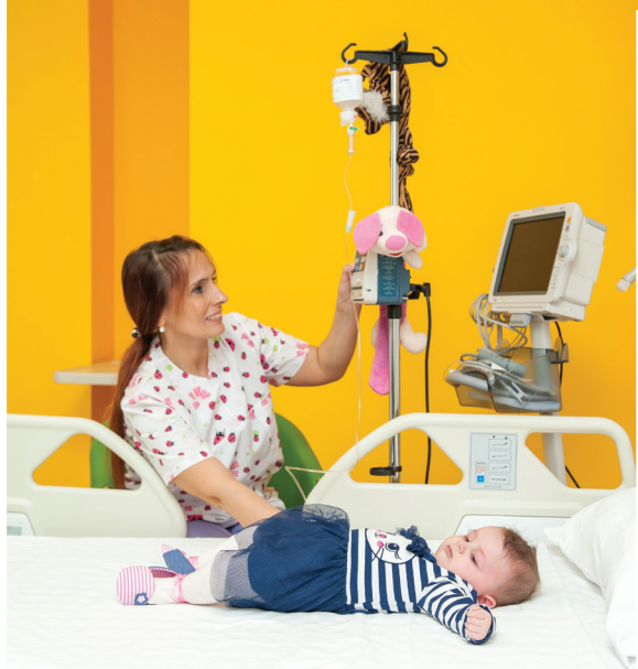
Собите наменети за деца до 14 години изгледаат како хотелски апартмани опремени со плазма телевизори и адаптирани купатила за деца